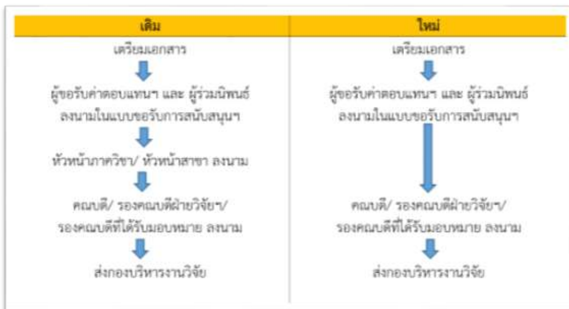
ภาพที่ 4.1 ขั้นตอนการเบิกจ่ายค่าตอบแทนการตีพิมพ์

เนื่องจากคณะเทคโนโลยีเสนอให้คณะกรรมการวิจัยพิจารณาเกี่ยวกับการลดขั้นตอนการเบิกจ่ายค่าตอบแทนการตีพิมพ์ เพื่ออำนวยความสะดวกแก่นักวิจัยและให้เกิดความคล่องตัวในปฏิบัติงาน โดยได้เปรียบเทียบขั้นตอนดำเนินการแบบเดิมและแบบใหม่ ดังภาพที่ 4.1